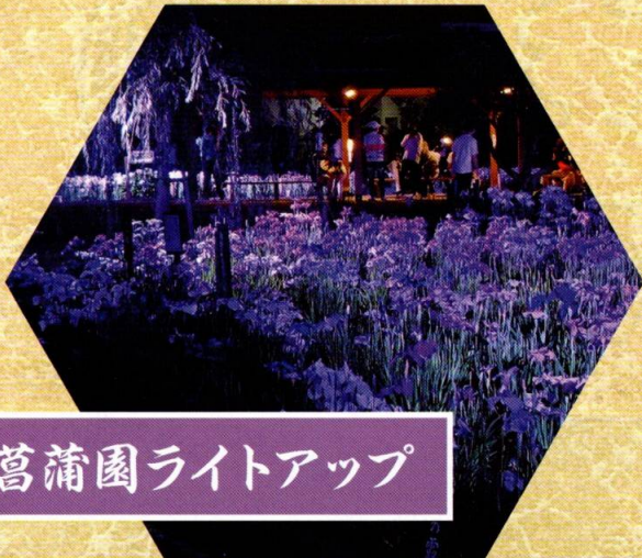
菖蒲園ライトアップ