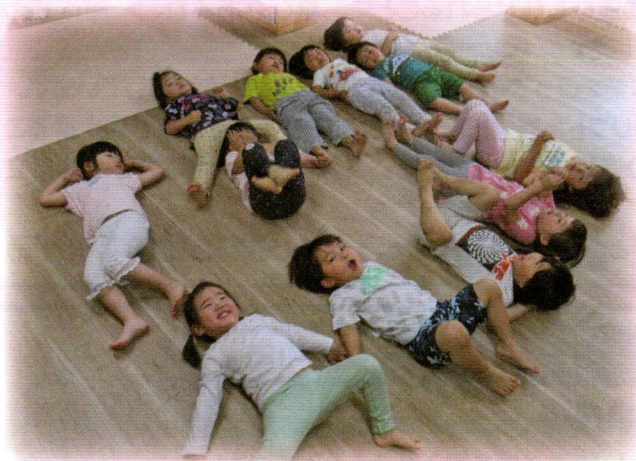
(N)KOTOともそだちネット 陽だまり保育園「こどもたちの保育室を整備しました。」

赤い羽根共同募金は子ども・家庭、高齢者、障がい者、まちづくりの推進など皆様に関わりのあるところで役立てられております。