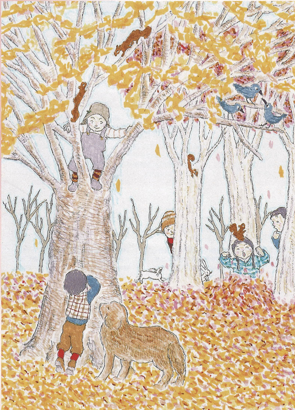
「かくれんぼ」 田辺 綾子 Artbility ※この作品は障害者アーティストによる作品です