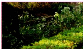
フジバカマ自然群生地