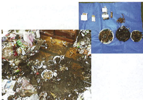
大量のたばこが入った灰皿による火災