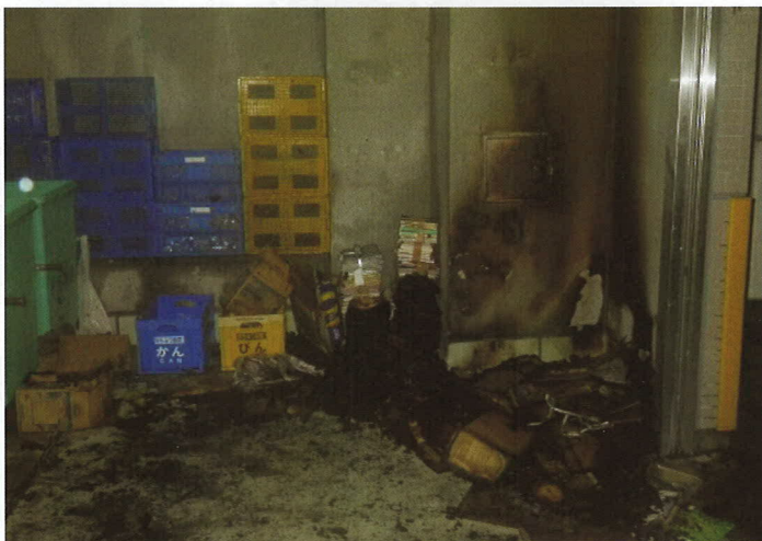
出火箇所付近の状況

放火火災は長時間放置されたごみや夜間の人通りの少ない時間帯等、人目のつかない場所で発生しやすい傾向にあります！