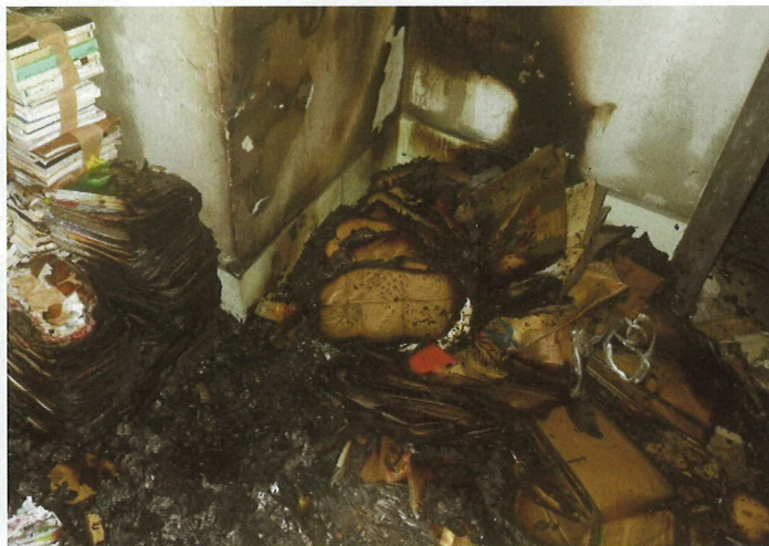
燃えた段ボールの状況