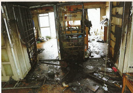
出火室の焼損状況