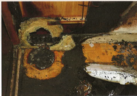
たばこを捨てたごみ箱付近の状況