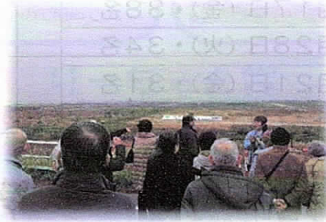
(②埋立処分場見晴らし広場の見学)

◎見晴らし広場では、現在の外側埋立処分場があと少しで埋め終わり、その後は新海面処分場が最後の埋立処分場になってしまうため、限られた場所を長く使えるようにしなければならないことを学びました。