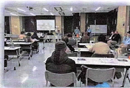
《西水元地区懇談会の様子》