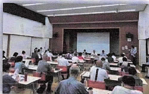
《高砂地区懇談会の様子》

清掃事務所職員・リサイクル清掃課職員から、葛飾区で取り組んでいるごみ減量事業などについて説明がありました。